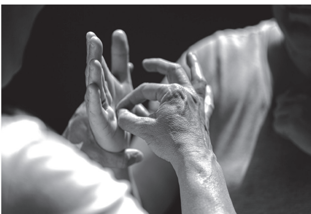
"Escuchar y hablar con las manos" de José L. Méndez Fernández. Segundo Premio 2024.