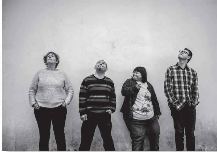
"Soñadores" de Gabriel Tizón. Finalista XX Edición Concurso de Fotografía: "Las personas con discapacidad en la vida cotidiana". Premio Fundación Aliados.

ses un fin de semana cada mes (de octubre hasta junio: jueves de 16.00 a 21.00h., viernes de 9:00 a 14.00h. y de 16.00 a 21.00h., y sábado de 9.00 a 14.00h), y consta de 11 módulos que abordan, en 90 créditos ETCS, distintos ámbitos de la vida de las personas con discapacidad. Adopta, además, una perspectiva de ciclo vital, pues se abarcan desde temas relacionados con la atención temprana, hasta necesidades que pudieran surgir durante el proceso de envejecimiento.