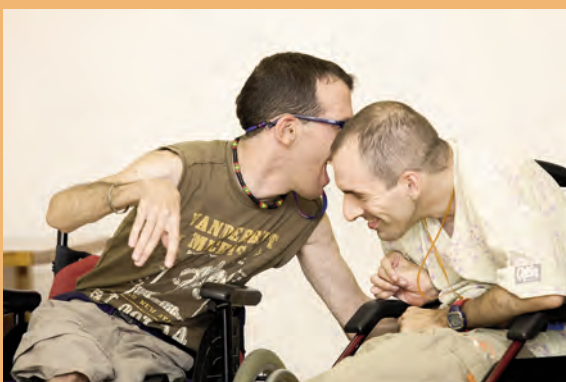
Amigos para siempre. Autor: Francisco J. López Finalista Concurso 2009