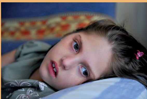
Andrea. Autor: David Campos Segundo Premio Concurso 2009