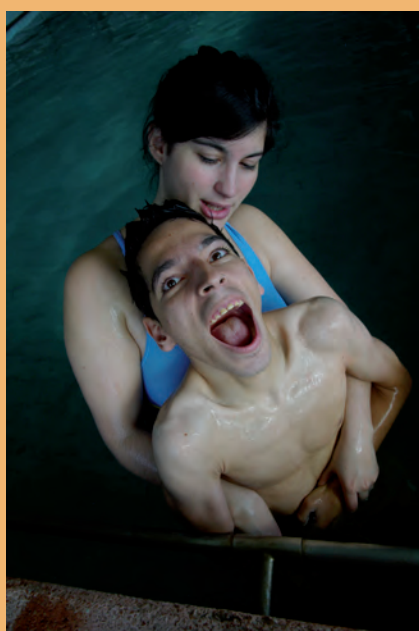
Piscina. Autor: José Ignacio Sánchez Primer Premio Concurso 2009