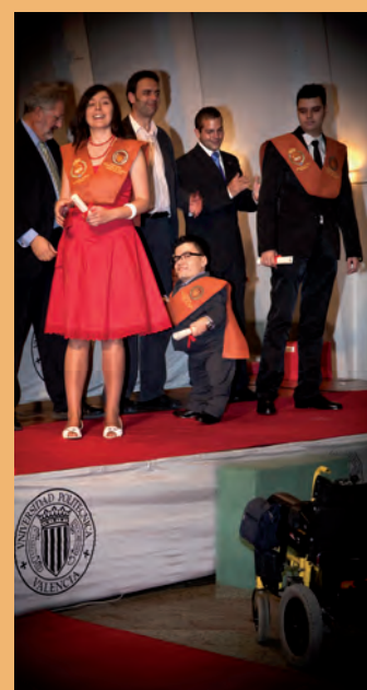
El Licenciado. Autor: Manuel López Mención Universidad-Discapacidad Concurso 2009