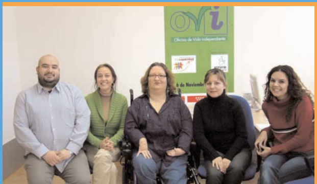
Miembros del Equipo

Tal y como aboga la Filosofía de Vida Independiente, las personas que tienen una gran diversidad funcional también tienen derecho a vivir como ciudadanos y ciudadanas "de primera" y, para ello, entiende que es preciso fomentar políticas públicas destinadas a este grupo de personas que se fundamenten en los Derechos Humanos. Ahora mismo, ya es una realidad el hecho de que la "promoción para un autonomía personal, mediante una Vida Independiente", es un Derecho Humano básico para la ONU (Art. 19), y ratificado por España el 30 marzo de 2007. Ahora bien, la OVI, compuesta por un Equipo Técnico encabezado por una persona Experta en esta materia y que, ella misma,