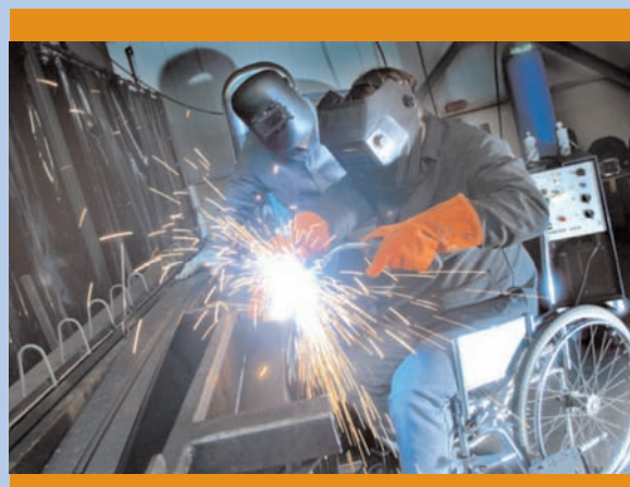
"Preparado" 2º Premio Concurso de Fotografía del INICO 2005

Si bien la discapacidad es un factor que supone con frecuencia la aparición de situaciones discriminatorias, también el género o la edad son factores que pueden llevar a situaciones de discriminación. El problema que nos encontramos es que con mucha frecuencia, por no decir habitualmente, las condiciones susceptibles de discriminación suelen ser sumativas, por lo que sus efectos se incrementan. Los datos del estudio nos indican que la mayoría de trabajadores son hombres entre 26 y 45 años, siendo este el patrón más común en todos los países exceptuando a Finlandia donde se producen algunas