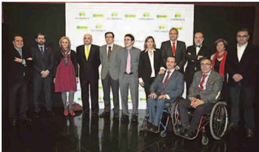
Foto de familia con los ganadores de los Premios Solidarios de la ONCE.

Milagros Marcos destaca que el 27% de los discapacitados tiene un empleo en la región