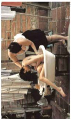
Fotografía reconocida por la Usal

Carvajal Borja por la fotografía titulada «22 de Mercedes 3», con la que ha ganado el XI Concurso Internacional «Las personas con discapacidad en la vida cotidiana». Carvajal captó el instante en que una madre ayuda a bañarse a su hija con discapacidad, instantánea con la que ha obtenido los 2.000 euros de un certamen que anualmente organiza el Inico, en colaboración con la Fundación