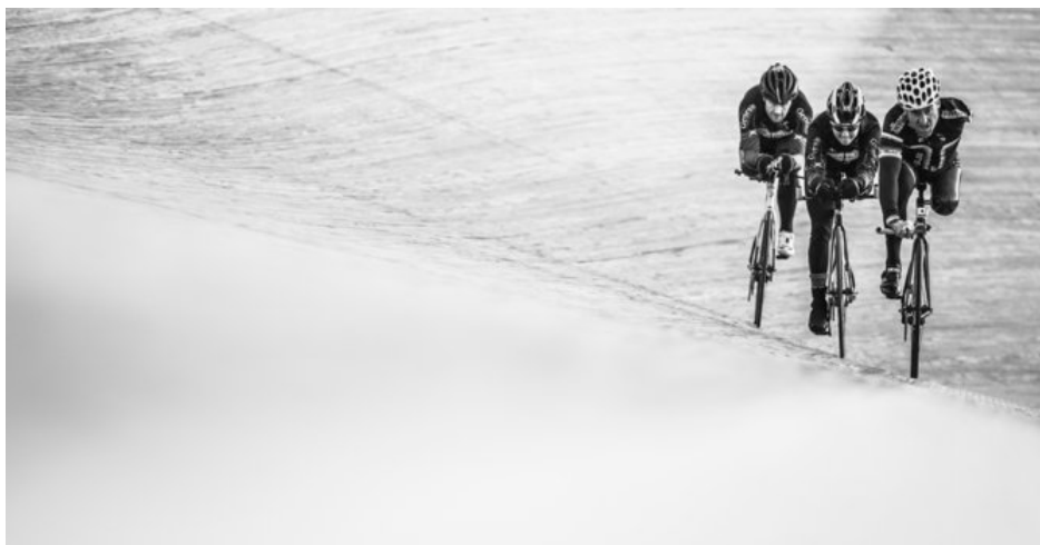
Fotografía ganadora del 2º premio