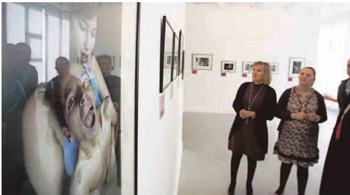
La muestra reúne fotografías desgarradoras como ésta que ilustra la noticia.