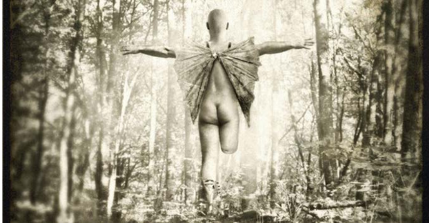
Fotografía ganadora del 3º premio