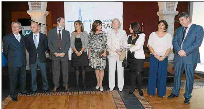
La consejera de Familia (cuarta por la izquierda) con los premiados y directivos de la Fundación Intras ayer en Arroyo de la Encomienda.

La Fundación Intras es una entidad sin ánimo de lucro que tiene como objetivo desde su constitución, en 1994, ayudar a las personas con discapacidad a causa de una enfermedad mental grave a recuperar su proyecto de vida. Lo logra a través de la puesta en marcha de recursos sanitarios, educativos, laborales, residenciales, de ocio y tiempo libre, así como con el desarrollo de investigaciones que ayuden a la inclusión social y laboral de estas personas, mejorando con ello su calidad de vida.