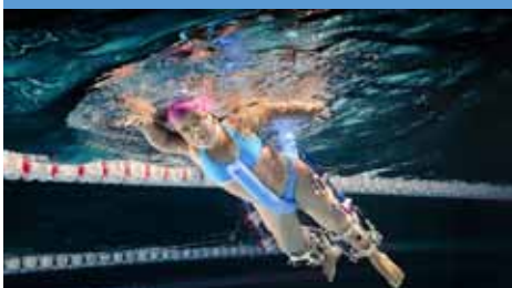
"Maia", de Andrés Gómez

Primer Premio Concurso de Fotografía del INICO 2015