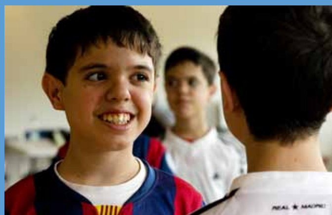
Finalista: Todos iguales. Todos diferentes, de Ignacio Camacho