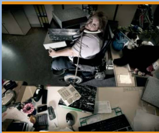
“Antonia”. Autor: Javier Arcenillas

Los trabajos del equipo nos han permitido elaborar una imagen cuantitativa (estática y dinámica) sobre todo de la menor participación laboral de las personas con discapacidad y de la discriminación salarial por discapacidad. Ambos aspectos son complementarios, pues el primero nos habla de un déficit de integración laboral y el segundo de un problema de peores condiciones de trabajo una vez que las personas con discapacidad ya están en el mercado de trabajo.