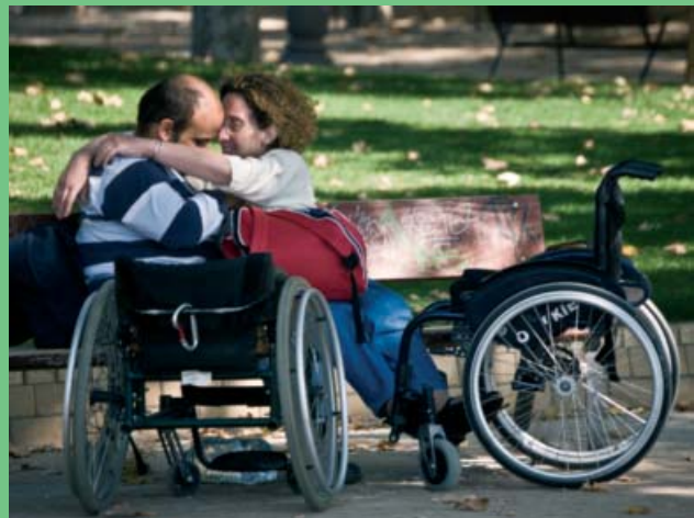
"Amorosos". Autor: Andrés Marín Velasco Fotografía Finalista IXª Edición 2011

Asimismo, gracias al apoyo de la Fundación Grupo Norte, se presentará un libro que recoge las 100 fotos más valoradas por el Jurado entre los años 2008 y 2012, que complementa al que se publicó con las fotos de los años 2003 a 2007 (puede verse en la web del Concurso).