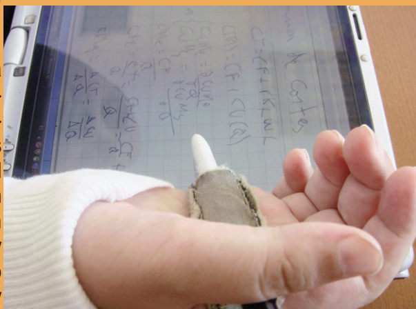
"Apuntes". Autor: Félix Macías López

Tras la finalización de la conferencia se produjo un espacio de debate donde los asistentes pudieron comentar y analizar las implicaciones de la implementación del DUA en el ámbito universitario de nuestro país. Las investigadoras por su parte conocieron de primera mano las distintas acciones que desde el INICO se vienen haciendo en la investigación y en la formación sobre el Diseño Universal para el Aprendizaje.