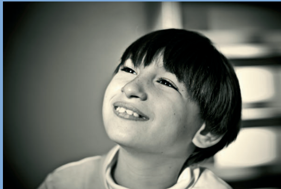
“Con luz propia”. Autora: Marta Recarte Domingo VIII Concurso “Las personas con discapacidad en la vida cotidiana”

La organización evaluará cada propuesta de Comunicación o Póster, determinando su aceptación o rechazo y lo comunicará a los solicitantes antes de finalizar el mes de Enero de 2013.